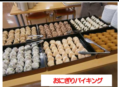
おにぎりバイキング