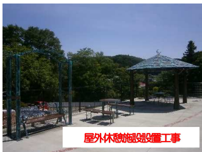
屋外休憩施設設置工事