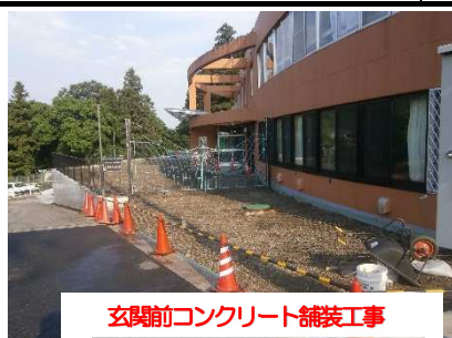
玄関前コンクリート舗装工事