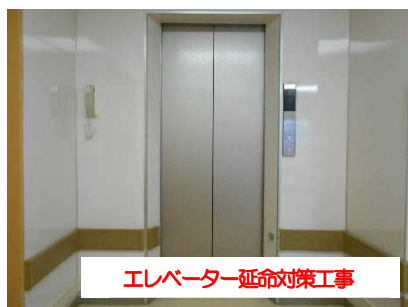
エレベーター延命対策工事