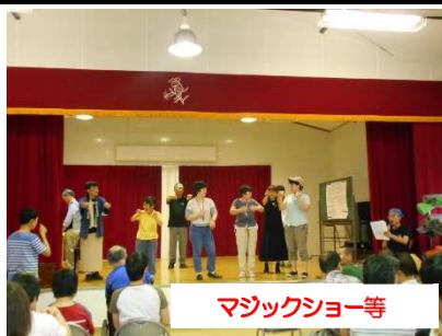
マジックショー等