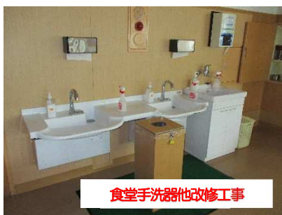
食堂手洗器他改修工事