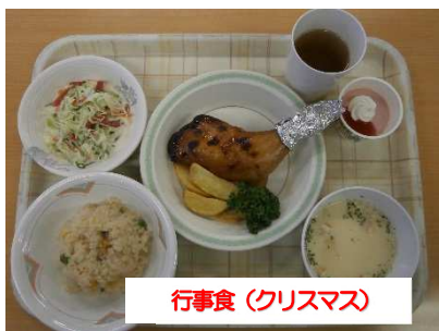
行事食（クリスマス）