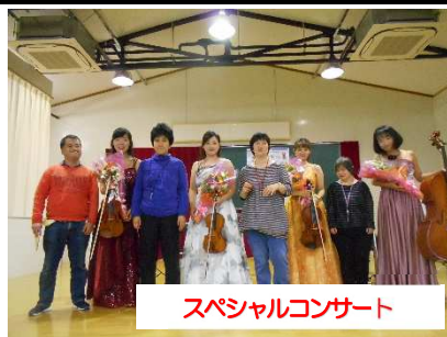
スペシャルコンサート