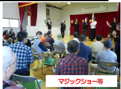
マジックショー等