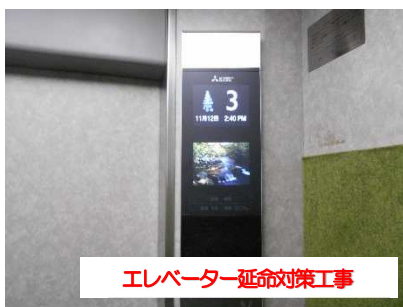
エレベーター延命対策工事