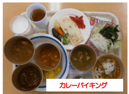
カレーバイキング