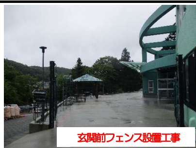
玄関前フェンス設置工事