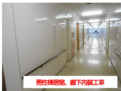
男性棟居室、廊下内装工事