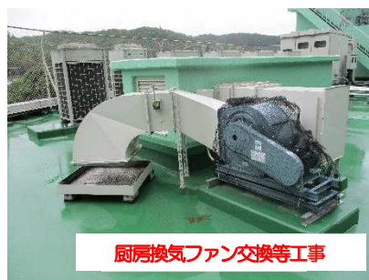
厨房換気ファン交換等工事