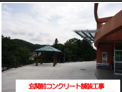
玄関前コンクリート舗装工事