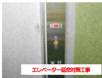
エレベーター延命対策工事